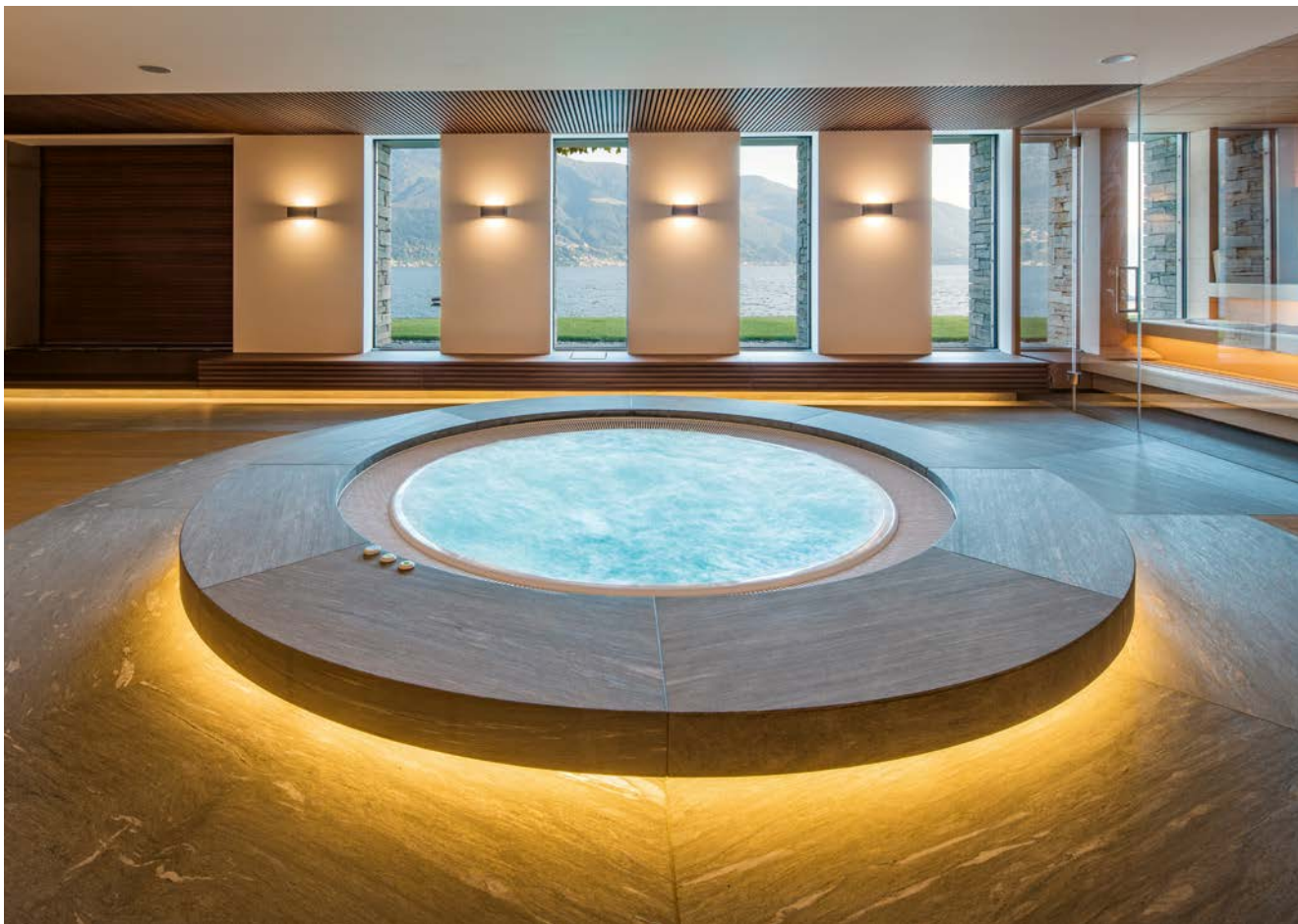
Bei Einbruch der Dunkelheit und eingeschaltetem LED-Lichtkranz wirkt der Whirlpool wie ein UFO, das gelandet ist.

um einen Stein aus dem nahegelegenen Onsernone-Tal. Er findet sich auch am Boden wieder, wo er dem Raum – in Kombination mit einem edlen Parkett – ein hochwertiges und anheimelndes Ambiente verleiht. Unterstützt wird dieses Gefühl durch die breite Holzlamellenverkleidung im Rücken der Ruheliegen und der großzügigen Fensterfront, die den Blick in die unverbaute Natur ermöglicht.